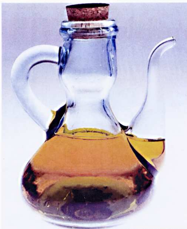
LA COULEUR DE L'HUILE DE NOIX

La noix a regagné du terrain après l'hiver désastreux de 1956 où l'on entendait, rapportent quelques anciens, les noyers éclater à grand fracas à cause du gel. Les nuciculteurs sont sensibles à l'emploi de pratiques respectueuses de l'environnement. Des coquilles légèrement colorées ne sont pas synonymes d'un fruit sale mais le résultat de l'abandon du lavage avec de l'eau légèrement javellisée. La culture du noyer réclame très peu de traitements : le désherbage mécanique des plantations et leur irrigation constituent les principaux soins culturaux. La station expérimentale de Creysse dans le Lot, pôle régional du grand Sud-Ouest, contribue à améliorer les techniques culturales, perfectionner la protection contre les parasites et les ravageurs, sélectionner de nouvelles portes-greffes ou hybrides.